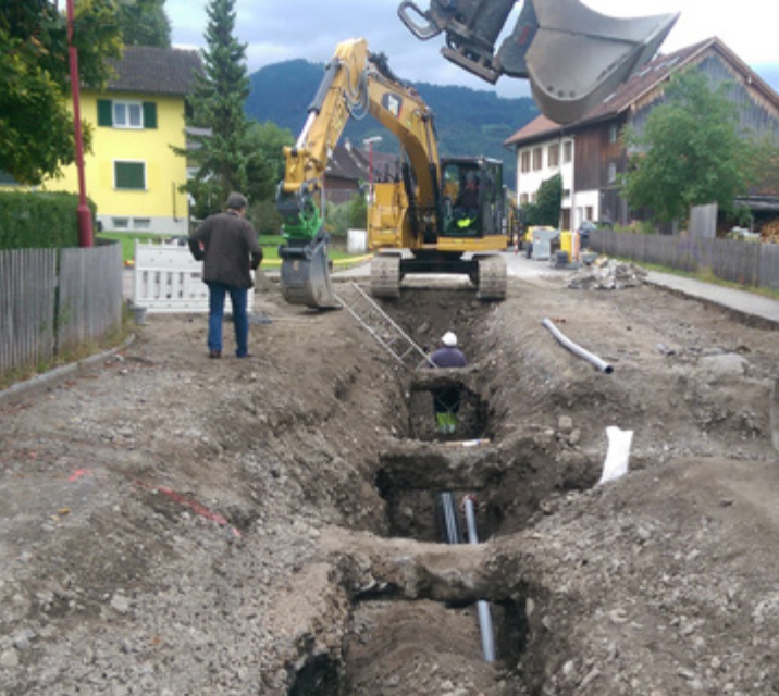
Alemannenstraße: Wasserleitung erneuert