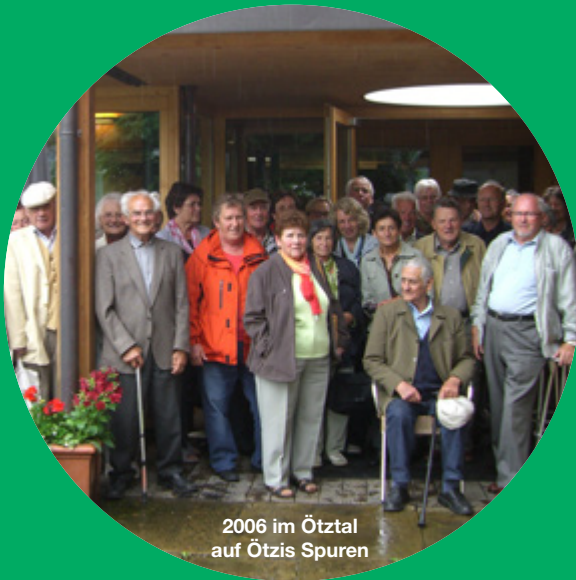
2006 im Ötztal auf Ötzis Spuren