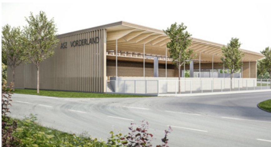
Das ASZ Vorderland in Sulz wird in Sachen Abfallverwertung und Bürgerservice neue Standards in der Region setzen.

Darüber hinaus steht 2018 die Umsetzung weiterer regionaler Projekte an, etwa in den Bereichen Gemeindekommunikation (u.a. Neukonzeption Gemeindeblatt Rankweil), Wohngebäudesanierung (Sanierungslotse) oder regionale Produktvermarktung (Regionalmarkt Vorderland-Walgau-Bludenz).