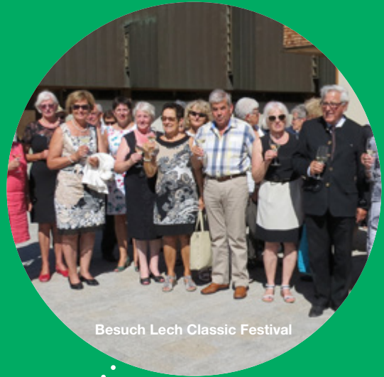
Besuch Lech Classic Festival